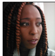
Tiommi Lockett Transgender Law Center